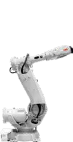
IRB 6640 185 - 235 kg 2,55 - 2,80 m