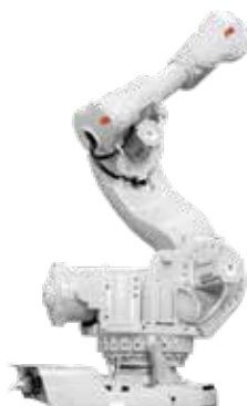
IRB 7600 150 - 500 kg 2,55 - 3,50 m