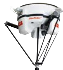
IRB 360 Flexpicker 1 - 8 kg 0,80 - 1,60 m