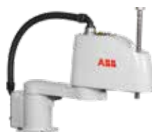
IRB 910SC Scara 3 kg 0,45 - 0,65 m