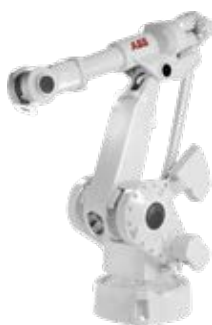
IRB 4400 10 - 60 kg 1,96 - 2,53 m