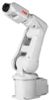
IRB 120 3 kg 0,58 m