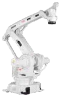
IRB 460 110 kg 2,40 m