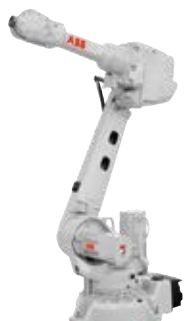
IRB 2600 12 - 20 kg 1,65 - 1,85 m