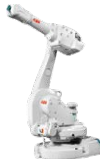
IRB 1600 6 - 10 kg 1,20 - 1,45 m