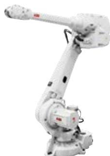
IRB 4600 20 - 60 kg 2,05 - 2,55 m