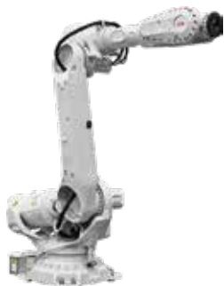
IRB 6700 150 - 300 kg 2,60 - 3,20 m