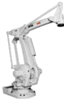
IRB 660 180 - 250 kg 3,15 m