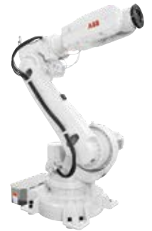
IRB 6620 150 kg 2,20 m