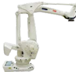
IRB 760 450 kg 3,18 m