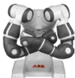
YuMi - IRB 14000 0,5 kg 0,50 m