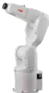
IRB 1200 5 - 7 kg 0,70 - 0,90 m