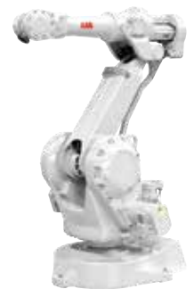
IRB 2400 12 - 20 kg 1,55 m