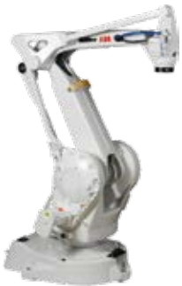
IRB 260 30 kg 1,56 m

Répétabilité de positionnement = 0,02 mm.