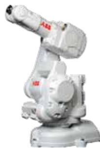
IRB 140 6 kg 0,81 m